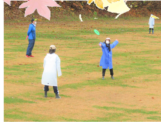
フライングディスク：飛距離を競いました