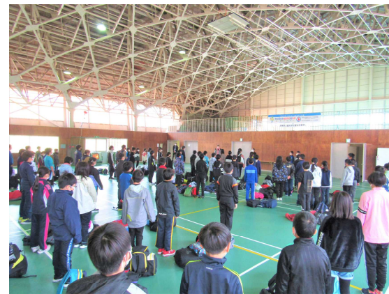
退所式：大きな声で感謝の言葉を述べました