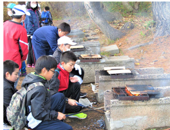
焼板工作：オリジナルプレートができました