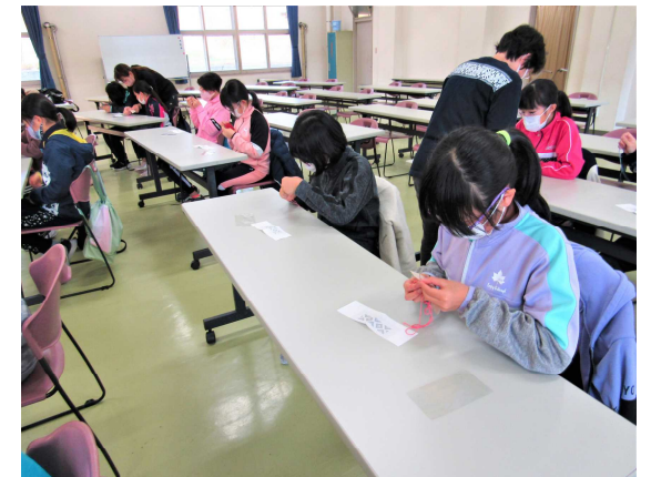
こぎんざし：糸の通し方を教わりました