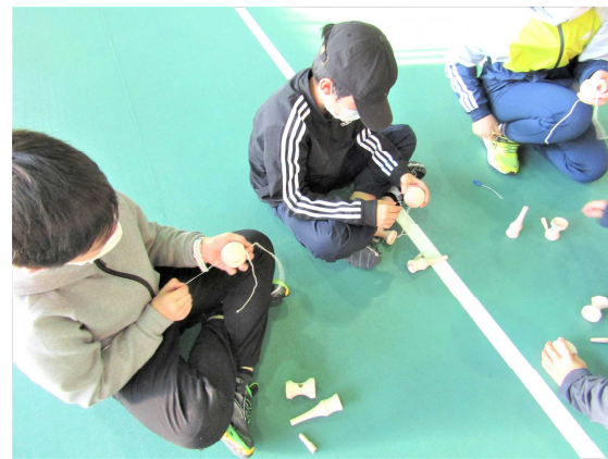
けん玉作り：紐を通すことが難しかったです