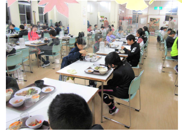
食堂：食事係が準備を頑張りました