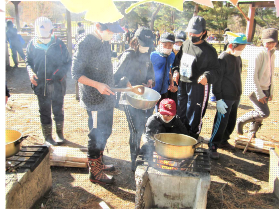
野外炊事：とても美味しいカレーでした