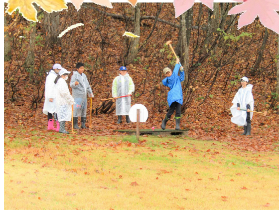
パークゴルフ：空振りが多かったです