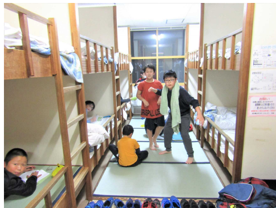
宿泊室：二段ベットで熟睡しました