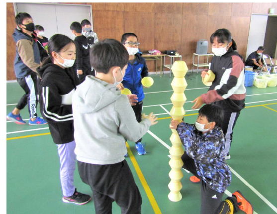
ニューゲーム：お椀を高く積み上げています