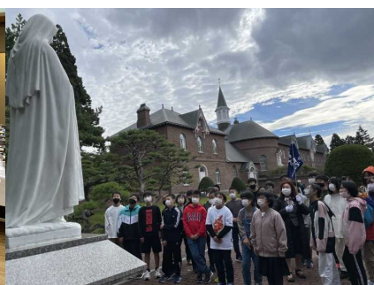
トラピスチヌ修道院見学