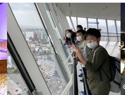
五稜郭タワーから