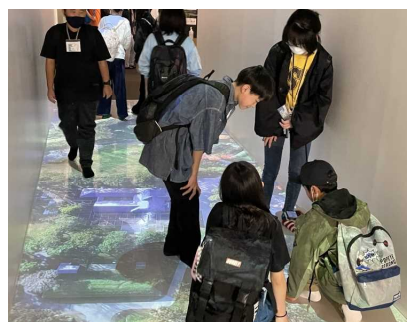
はこだてみらい館