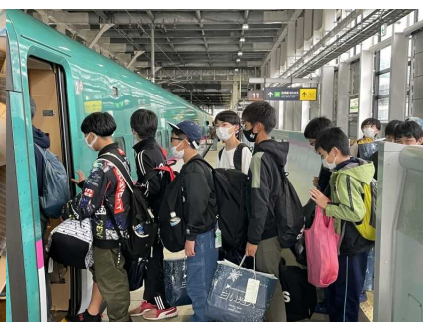
新幹線のホームで