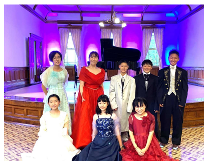
公会堂のお姫様体験