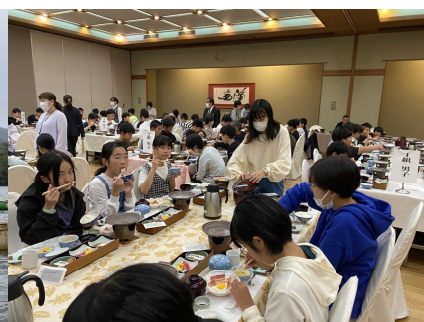
ホテルの美味しい夕食