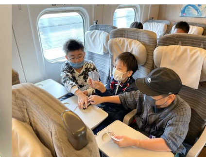
車内でカードゲーム