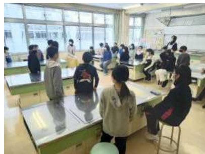
↑ 新委員会組織会の様子 (1/16)