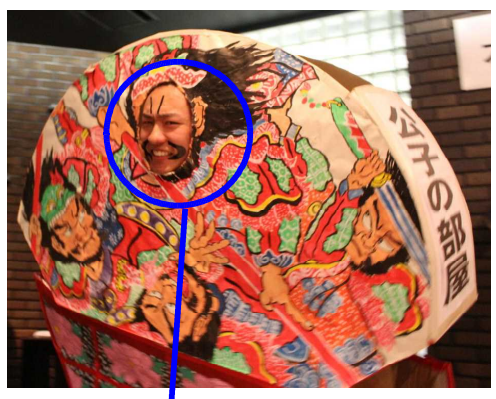
「公子の部屋」が評判とのことで、記念に「一部顔出し立体ねぶた」を作ってみました。さて問題です。この部分はだれ先生か分かりますか?