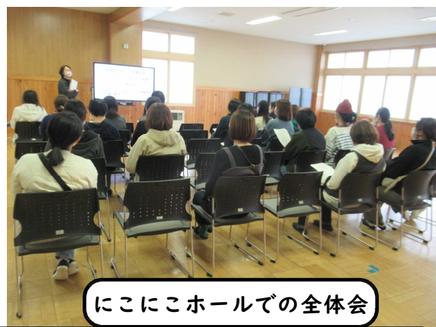
にこにこホールでの全体会

2月19日(月)の6年生から始まり、28日(水)の1年生まで、今年度最後の参観日が行われます。児童の待機場所(図書室)を確保したためか、いつもより多くの皆さんに全体会に出席いただき、ありがたく思っております。また、駐車場に他学年の保護者等の送迎車がほとんど来ないため、今のところ事故なく安全に実施できていることに感謝申し上げます。