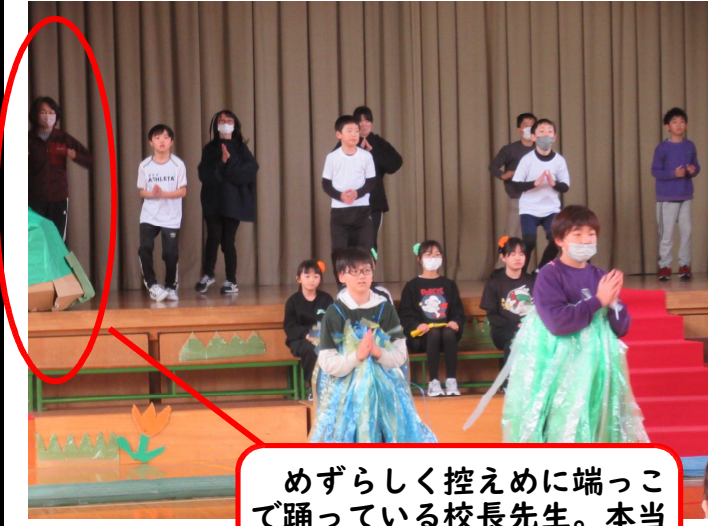
めずらしく控えめに端っこで踊っている校長先生。本当はセンターで踊りたかったはず… (by 教頭)

ラストイヤーにやりたいこととして、「子どもたちと一緒にマラソン走りたい」は実現できたので、残るは「子どもたちと一緒に踊りたい」ということ。そうしたら、この前チャンスが到来しました!5年生が参観日に行く劇の中で、ダンスを披露するということが十数名の子が熱心に練習していたので、担任の先生に「私もこっそり入れて!」とお願いし、DVDを見たり、子どもたちに何度か教えてもらったりしました。一緒に合わせる時間があまりなかったのですが、自分の目標は、小学生の中において違和感がないようにするという事です。当日、ジャージにマスクをして、後ろの端っこで踊らせてもらいました。その後、誰からも、「校長先生、出てたでしょ!」と言われなかったので、私の目標は達成されたのでしょうか!担任時代に子どもたちには「踊る肉だんご」と言われたことがある私ですが、5年3組の保護者のみなさん、気付きましたか?機会があれば他の学年とも踊りたいです。