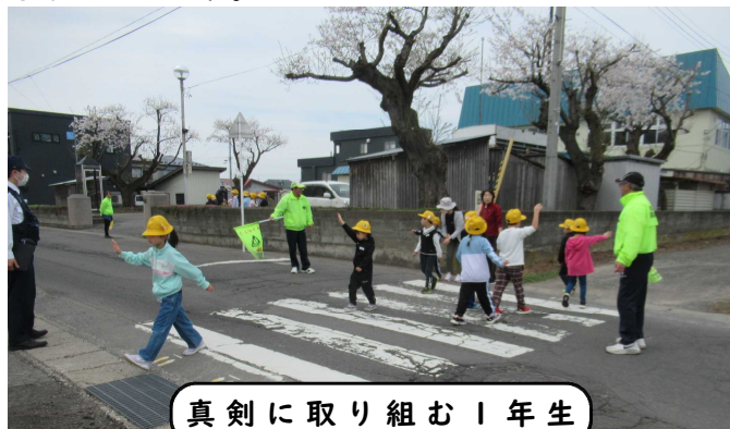
真剣に取り組む1年生

4月16日(火)に交通安全教室が行われました。1、2年生は実際に道路に出て安全に歩く練習をしました。ちとせ交番のおまわりさんや地域の交通防犯部(見守り隊)の方々の協力を得て安全な歩行の仕方を確認しました。登下校や休みの日に、学んだことを思い出して事故に遭わないように気を付けてもらいたいです。