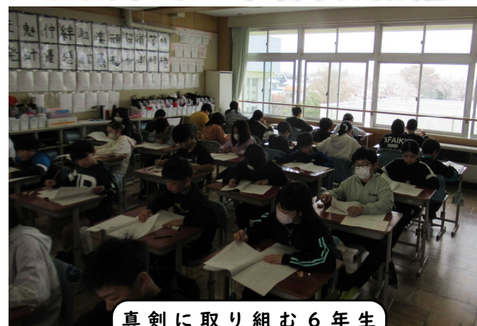
真剣に取り組む6年生

4月18日(木)、全国の6年生が挑んだ全国学力・学習状況調査(国語・算数)を本校も行いました。結果を授業改善に生かしていきます。