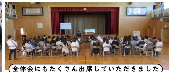
全体会にもたくさん出席していただきました