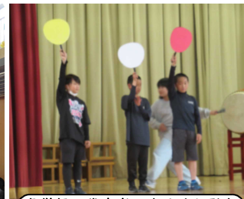
各学級の代表者によるくじ引き