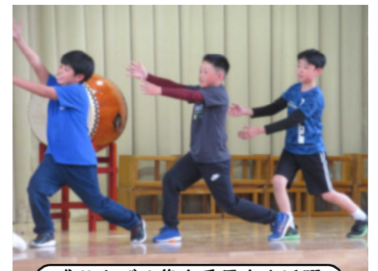
盛り上げる集会委員会大活躍