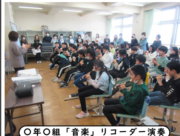
〇年〇組「音楽」リコーダー演奏

昨年度、4月の参観日は午前に行っていましたが、授業参観後に保護者が残って先生方に相談できなかったり、新担任になっても授業を見せるだけで保護者と話す時間が設定できなかったりという反省があり、午後の実施に変更しました。授業参観後、全体会にもたくさん残っていただきましたし、先生方と個人的にお話する保護者の姿も見られました。学校と家庭が手を取り合いながら子供の成長を見守っていきましょう。