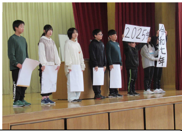
冬休み明け集会で楽しく発表する集会委員会！