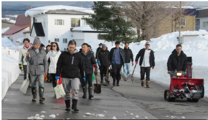
除雪を終え集合場所へ向かう参加者、かっこいい

1月13日（月・祝）に行われた「PTA通学路・スクールバス停留所除雪作業」には、たくさんの保護者や先生方、教育委員会の方に参加いただき、学校近くの歩道や非常口付近、体育館の入口付近等の除雪をしました。この日は天気がよく、晴天のもとでの作業となりました。約1時間30分の作業でしたが、参加してくださった皆さん、本当にありがとうございました。