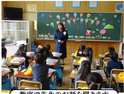
教室で先生のお話を聞きます