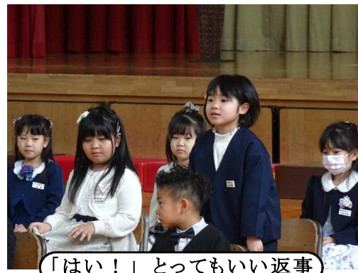
「はい!」とってもいい返事