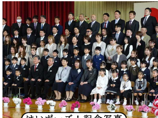
はいポーズ!記念写真