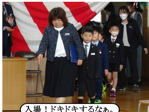
入場!ドキドキするなあ。

4月7日(月)、令和7年度の入学式がありました。朝のうちは雨が降ったりしていましたが、だんだんと天気がよくなり、入学式が始まる頃には、とてもいい天気になっていました。1年生64名全員が出席し、入学式を行うことができました。約30分間の式でしたが、学級担任による呼名にも「はい」とはっきりと返事できる子が多く、とても温かい雰囲気だったと思います。「太陽の学校」の一員として楽しい学校生活を送ってくれるものと信じています!ご入学、本当におめでとうございます。