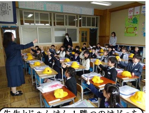
先生とじゃんけん!勝つのはどっち