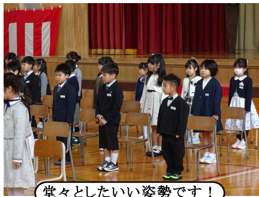
堂々としたいい姿勢です!