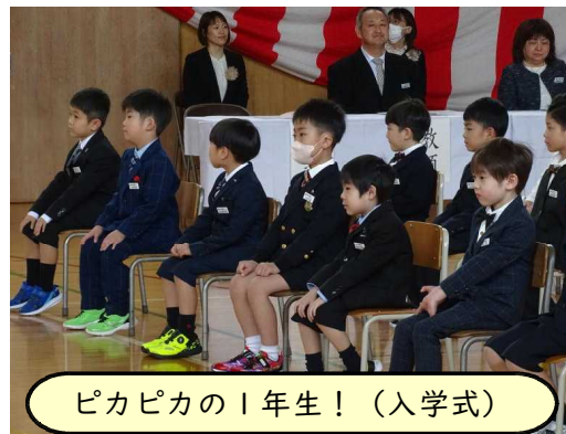
ピカピカの1年生！（入学式）