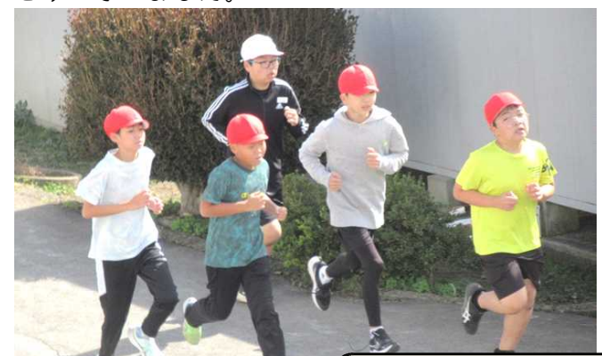
6年生 小学校最後の記録会

今年は天気に恵まれ、10月14日(火)に3・6年生、15日(水)に5・2・1年生、17日(金)に4年生が、マラソン記録会を行いました。あきらめないで頑張る真剣な表情や見ている人の応援の音がとてもいいと思いました。おうちの人もたくさん応援に駆けつけてくださいました。ありがとうございました。