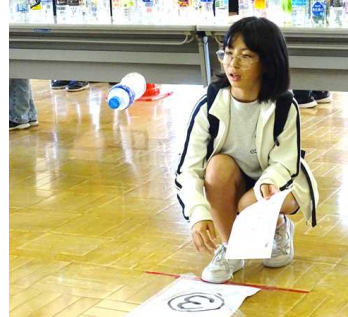
ペットボトル、立つでしょうか?

10月4日(土)、東小まつりが開催されました。今年、本校と幼保小連携事業を行っているこども園・保育園の年長組の皆さんにもお声がけさせていただき、447人の小学生や幼児が楽しんでくれました。吹奏楽部の演奏、マイルズ先生との「英語で遊ぼう!」のオープニングセレモニーの後、「ビンゴ」「キックボール」「射的」「くじ」「ペットボトルチャレンジ」の5つのゲームを楽しみました。たくさんの歓声や笑顔が見られ、今年も楽しい東小まつりになりました。前日の準備から当日の運営までPTA役員の皆様には大変お世話になりました。ありがとうございました。